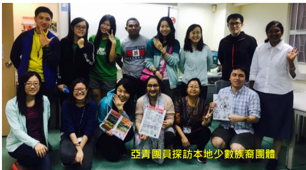
亞青團員探訪本地少數族裔團體